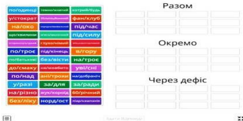
Рис. 2. Інтерактивний тест «Правопис складних слів»

«Орфографічні помилки», «Правопис складних слів», «Правопис прислівників» тощо. Нижче на рис. 3 наведено зразок інтерактивного тесту. Прокоментуємо методику його використання. Після вивчення теми «Правопис складних слів» учитель разом з учнями на мультимедійній дошці запускає контрольний тест і першу його частину виконують всі разом, коментуючи орфограми і зазначаючи частини мови. Інший тест надсилається учням на смартфон або планшет і в такий спосіб здійснюється індивідуальна перевірка навчальних досягнень щодо орфографічної компетентності. Після завершення тесту, учні надсилають вчителю результати.