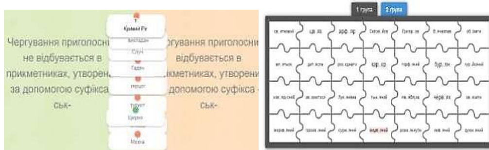
Рис. 3. Інтерактивні тести, створені за допомогою LearningApps.org

Для створення інтерактивних тестів можна скористатися й сервісом LearningApps.org. для організації поточного чи підсумкового контролю.