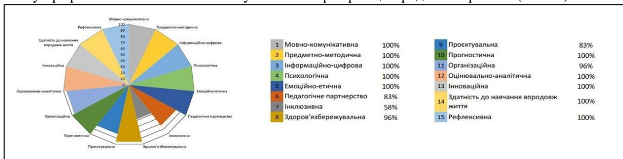
Рис. 2. Приклад результатів самооцінювання учасника сертифікації

Для другого етапу самооцінювання використовується інформаційно-аналітична система EvaluEd, що дозволяє учасникам швидко надіслати анкети та отримати рефлексію. Анкета містить 60 тверджень, зміст яких відповідає трудовим діям професійних компетентностей, зазначених у Професійному стандарті за професіями «Вчитель початкових класів закладу загальної середньої освіти», «Вчитель закладу загальної середньої освіти», «Вчитель з початкової освіти (з дипломом молодшого спеціаліста)». Для вчителів – це можливість з'ясувати стан розвитку їхніх професійних компетентностей, спланувати індивідуальну траєкторію професійного розвитку, звернути увагу на професійні компетентності, які вивчатимуться під час третього етапу. Візуально загальна тенденція розвитку професійних компетентностей учасників сертифікації продемонстрована (Рис. 2).