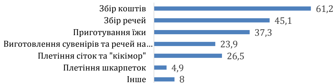
Рис.1 Види волонтерської діяльності, %*

* Сума відповідей не дорівнює 100%, оскільки респонденти могли обрати декілька варіантів відповідей