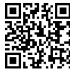
Мал. 1. Дошка «Підсумки проведення просвітницьких заходів у бібліотеках закладів освіти Одеської області»